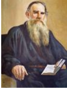
Лев Николаевич Толстой