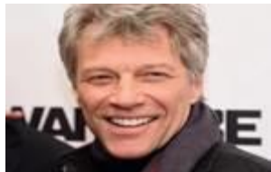
Джон Бон Джов

Успех - это когда ты девять раз упал, но десять раз поднялся.